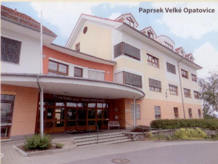
Paprsek Velké Opatovice