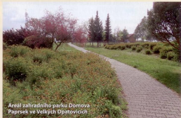
Areál zahradního parku Domova Paprsek ve Velkých Opatovicích